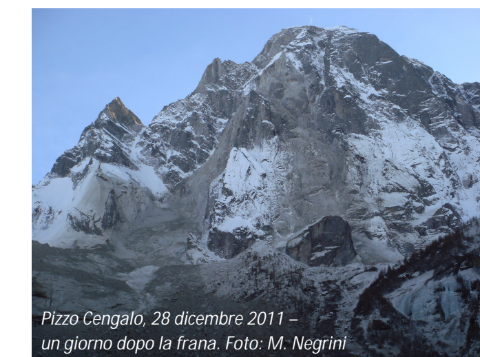
Pizzo Cengalo, 28 dicembre 2011 – un giorno dopo la frana.

Via di collegamento capanna Sciora – capanna Sasc Furà (Viale): COMPLETAMENTE CHIUSA FINO A NUOVO AVVISO! Questa via è soggetta alla continua caduta di sassi e rocce nonché in zona di pericolo acuta per la frana! PERICOLO DI MORTE!